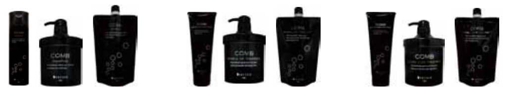
コンプライアンス シャンプー

300ml 1,800円(税抜) 700mlポンプ 3,900円(税抜) 600mlリフィル 3,000円(税抜)