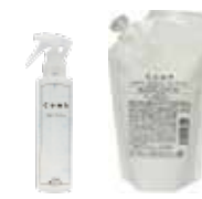
コンプライアンス スーパーローション